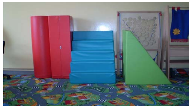
Alicja Bukala Zespół Szkół w Chmielniku