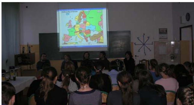
Międzynarodowe spotkanie wolontariuszy

o miliony młodych serc z całego świata, nie tylko te, które znamy z chmielnickich szkół. O ile o wolontariacie ogólnosiwiatowym mamy szczątkowe informacje, o tyle na temat wolontariatu europejskiego możemy już coś powiedzieć.