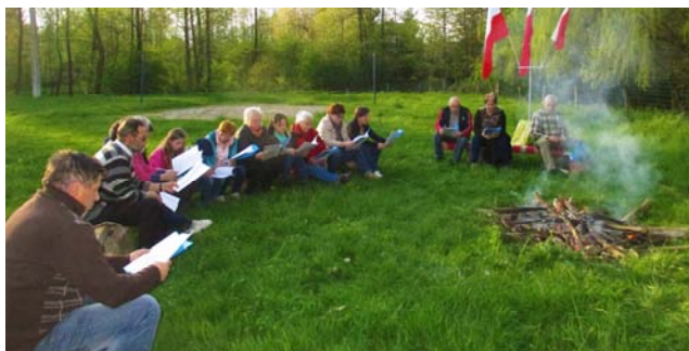
Ognisko Patriotyzmu 3-go Maja