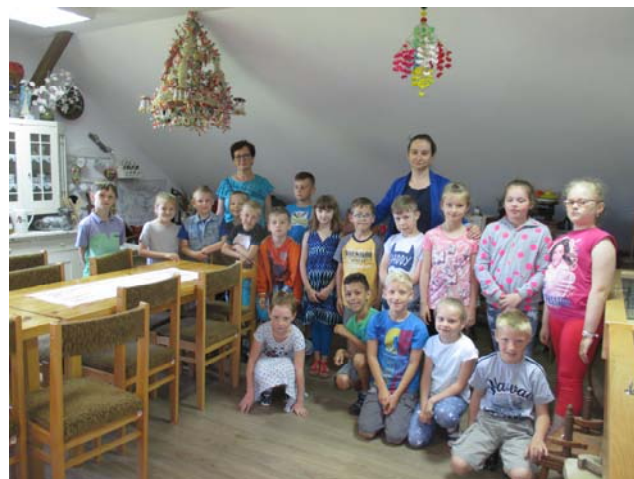
Wizyta w Izbie uczniów z Hyżnego