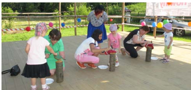
Mamy dzielnie wbijają gwoździe

Tradycyjnie 3-go maja członkowie Stowarzyszenia i sympatycy rozpalili na placu Arena Ognisko Patriotyzmu. Przy sprzyjającej pogodzie i trzaskach płonącego ogniska śpiewano pieśni patriotyczne i wojskowe piosenki. Było to miło spędzone świąteczne popołudnie.