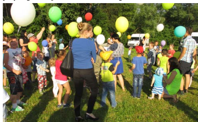
Przygotowanie do wypuszczenia balonów